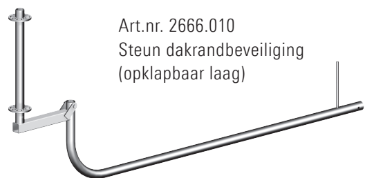
Art.nr. 2666.010 Steun dakrandbeveiliging (opklapbaar laag)

Ballastblokken voorkomen het kantelen van de dakrand-leuningstaanders.