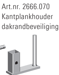
Art.nr. 2666.070 Kantplankhouder dakrandbeveiliging