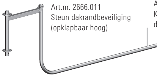
Art.nr. 2666.011 Steun dakrandbeveiliging (opklapbaar hoog)